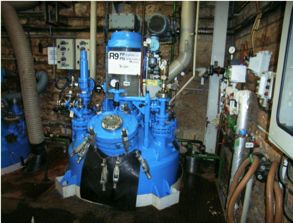
Photo 26 - Dôme d'un des réacteurs d'hydrogénation