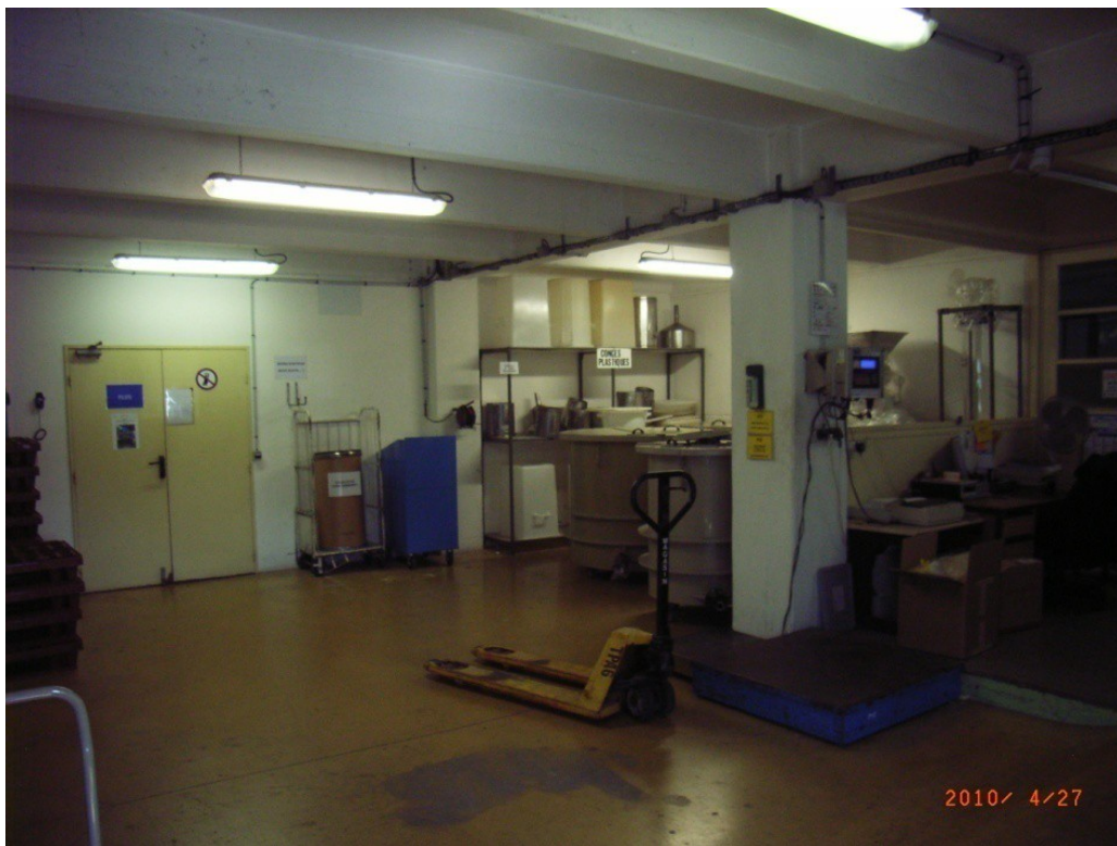
Photo 8 – Réception des matières premières et préparation des expéditions.