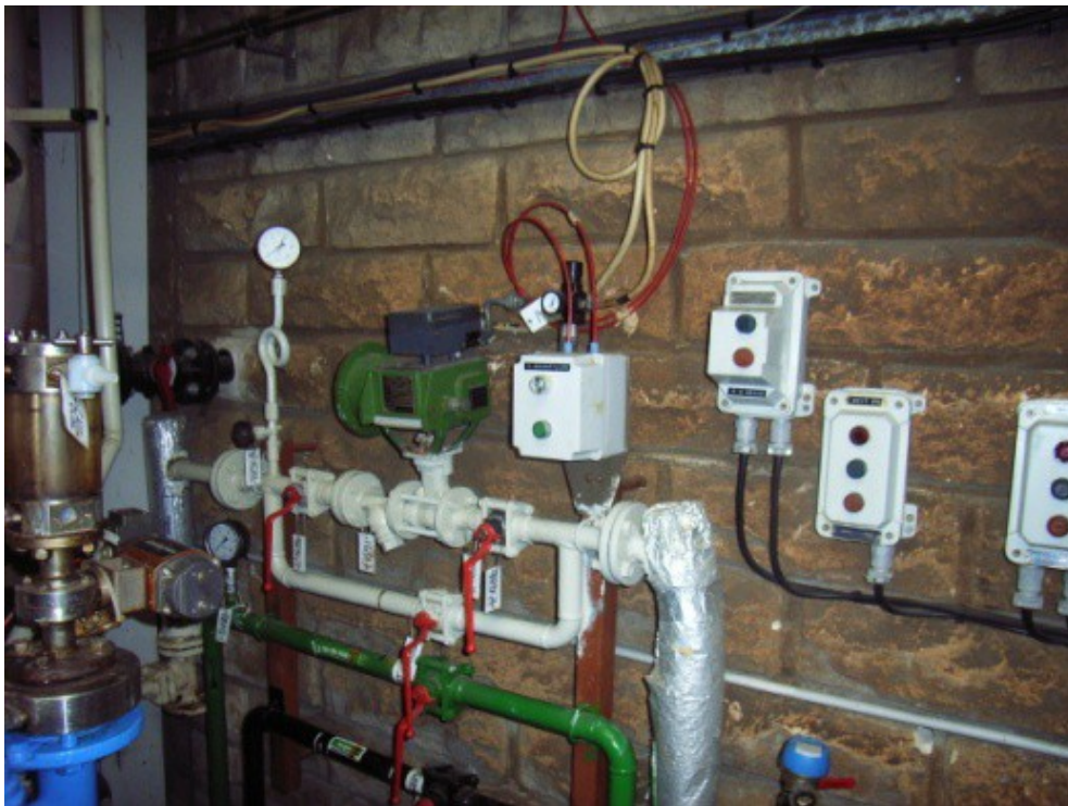
Photo 27 - Panoplie chauffage du réacteur R9