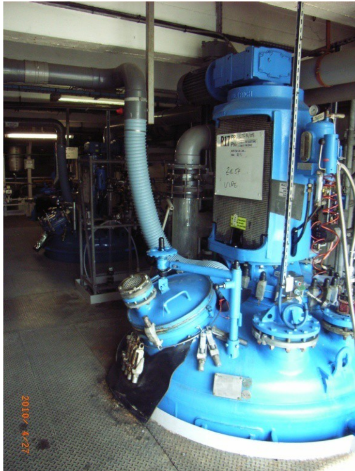
Photo 20 - Dôme du réacteur R17