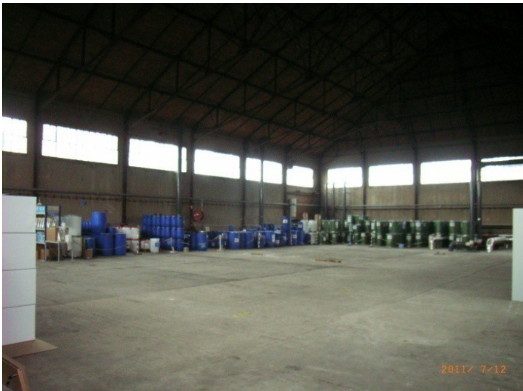
Photo 12 - Vue sur les emballages vides.