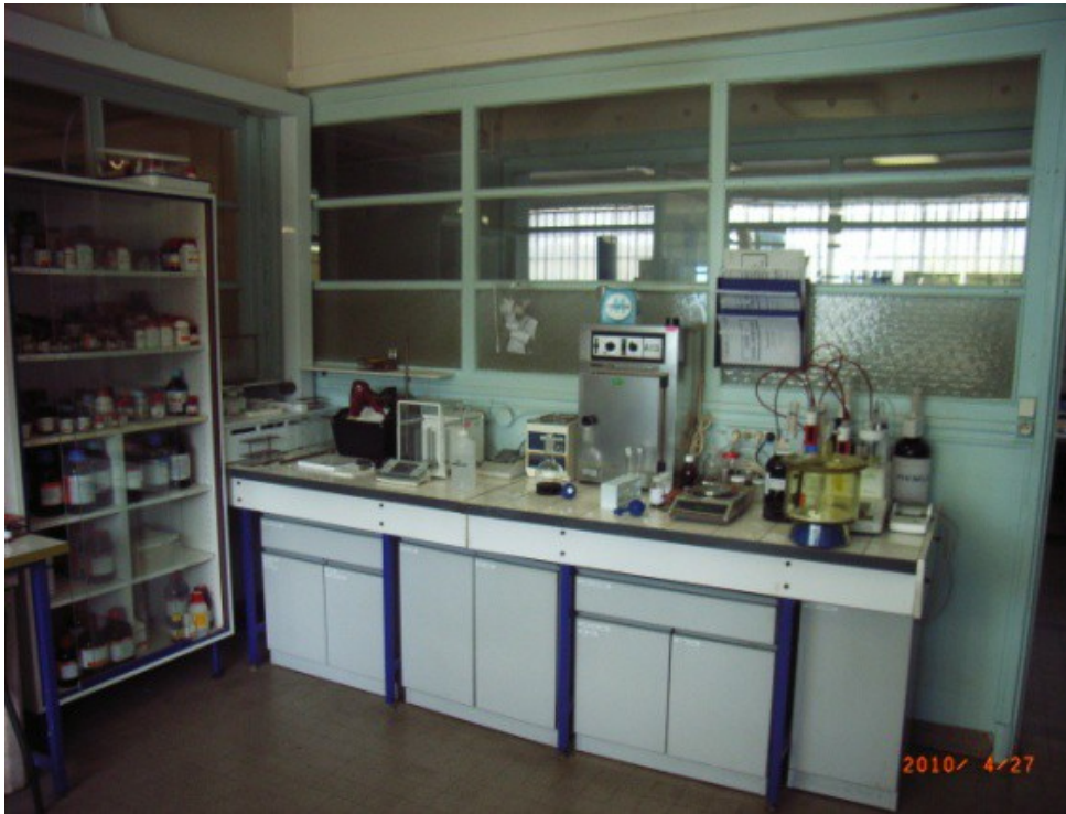
Photo 17 - Laboratoire 1