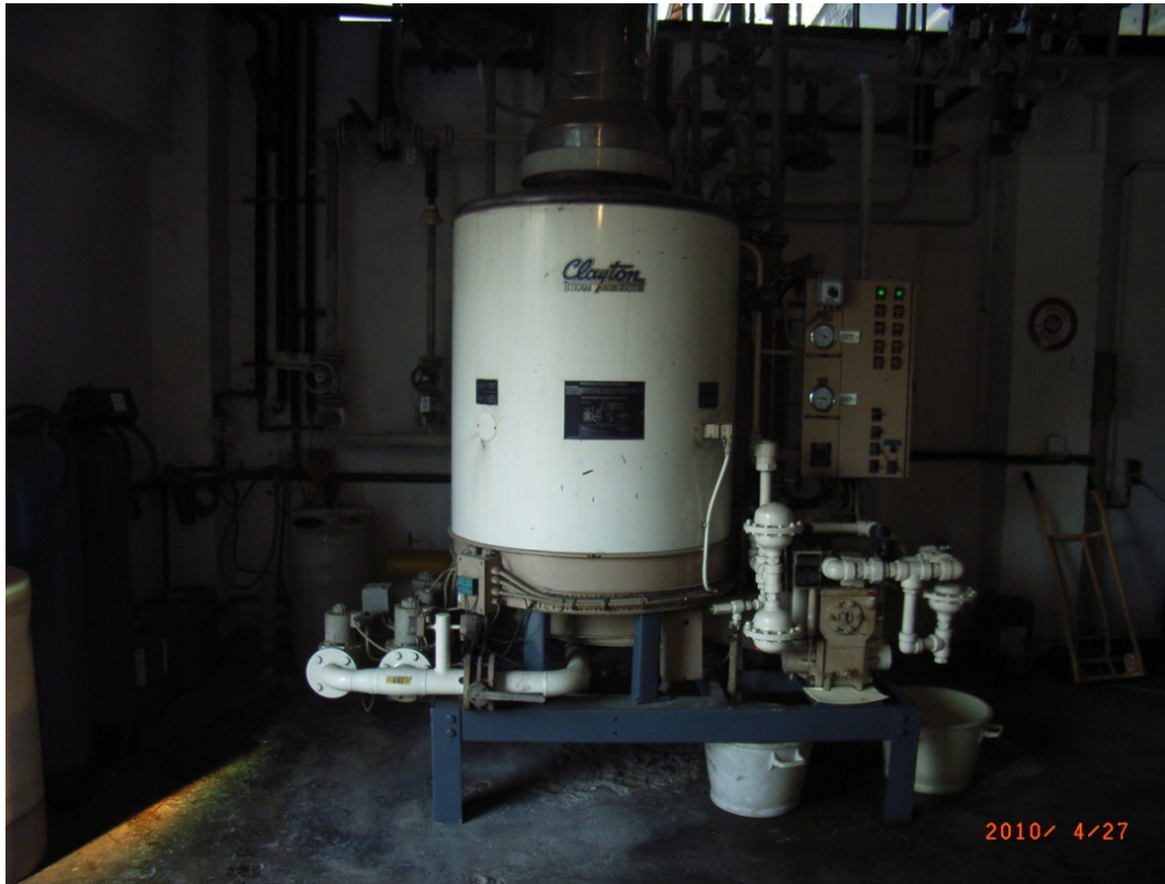
Photo 7 - Chaudière Clayton