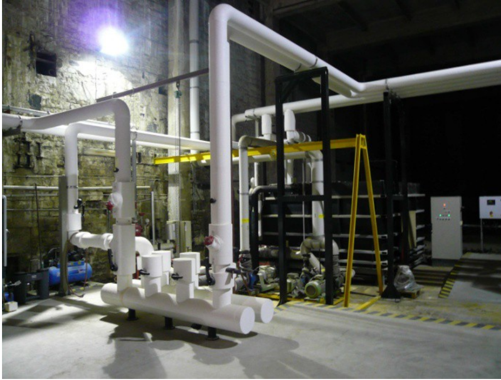
Photo 13 - Circuit de refroidissement