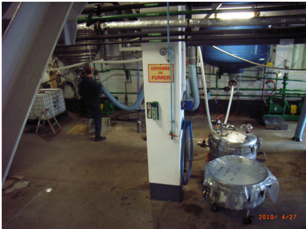
Photo 21 - RDC de l'atelier fabrication