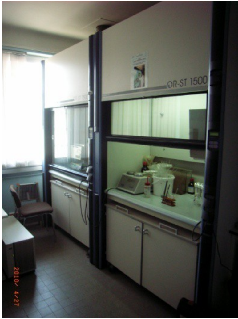
Photo 15 - Laboratoire 3