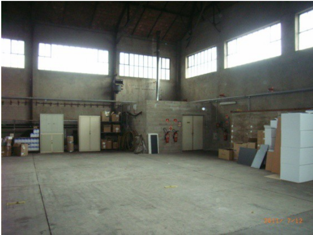
Photo 11 - Vue du local de la chaudière CHAPPEE