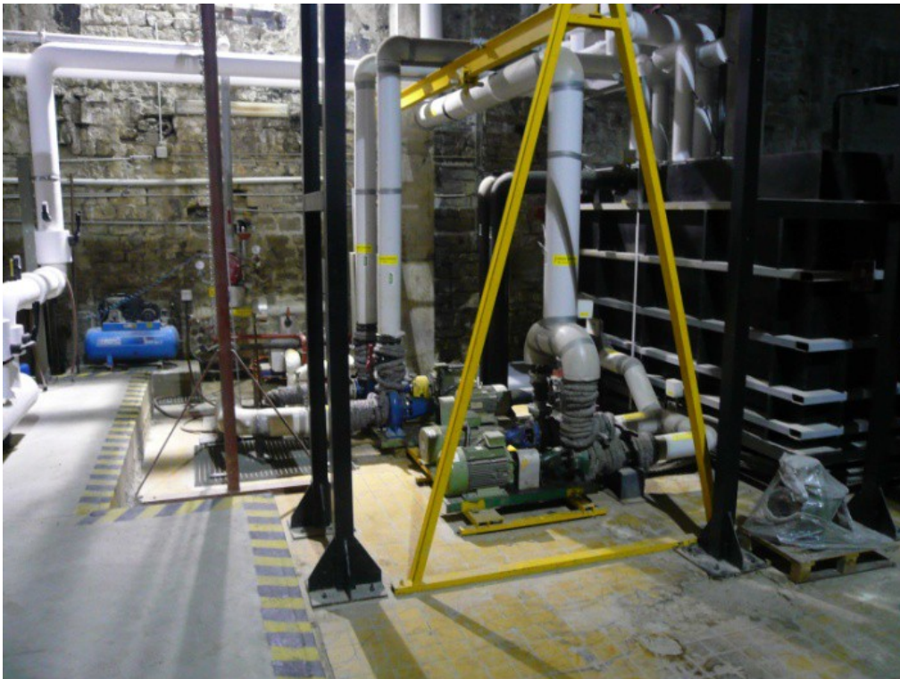
Photo 14 - Pompes du circuit de refroidissement