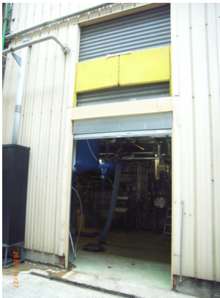
Photo 25 - Extérieur du local d'hydrogénation