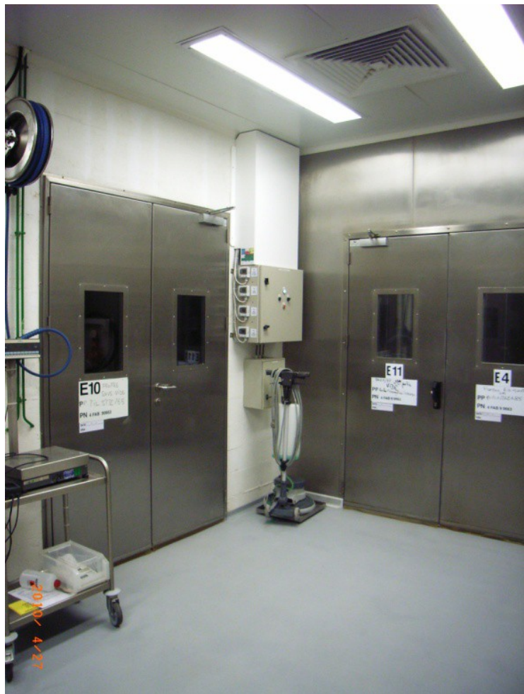
Photo 23 - Etuves