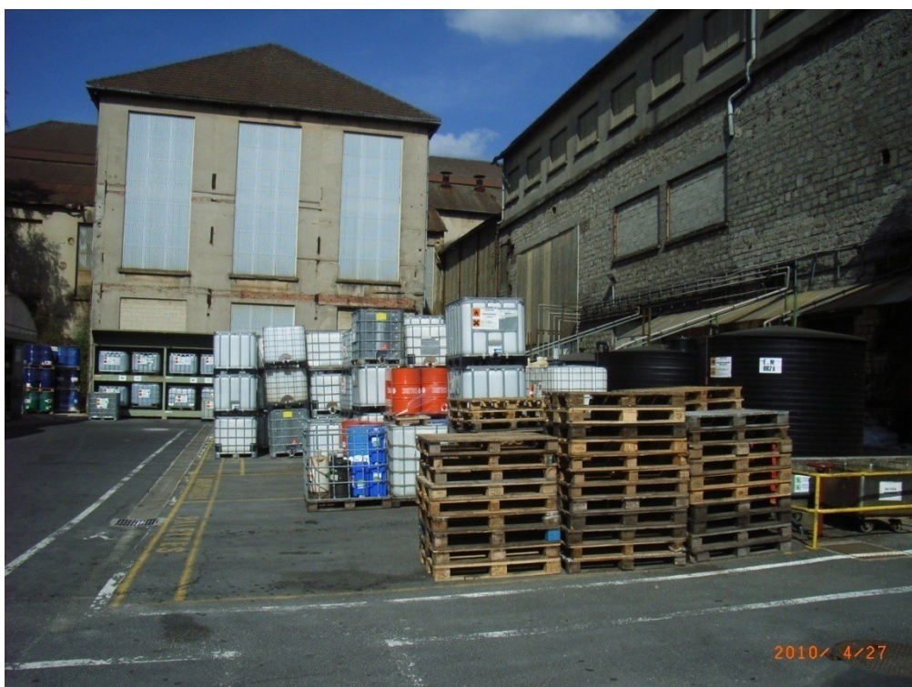
Photo 2 : au fond, un bâtiment de l'usine SCALA. Sur le côté droit, un des bâtiments de NORCHIM (bâtiment aux pigeons).